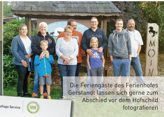
Die Feringäste des Ferienhofes Gerstand lassen sich gerne zum Abschied vor dem Hofschild fotografieren