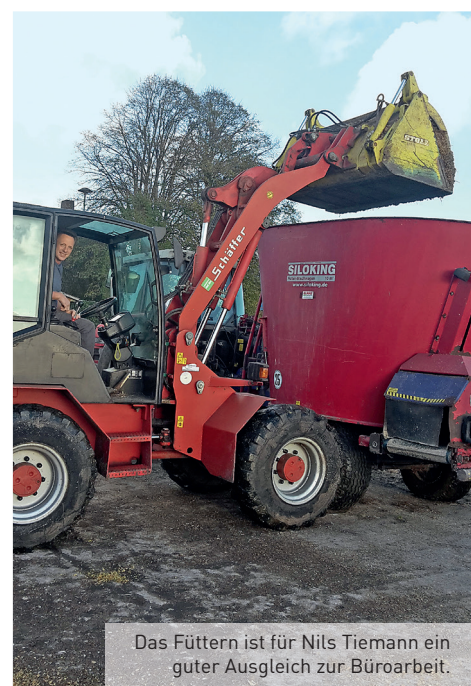
Das Füttern ist für Nils Tiemann ein guter Ausgleich zur Büroarbeit.