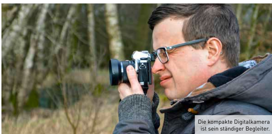
Die kompakte Digitalkamera ist sein ständiger Begleiter.