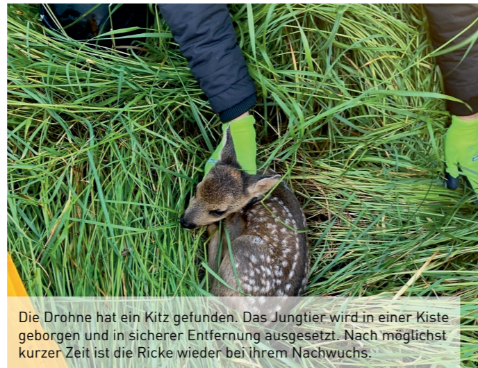
Die Drohne hat ein Kitz gefunden. Das Jungtier wird in einer Kiste geborgen und in sicherer Entfernung ausgesetzt. Nach möglichst kurzer Zeit ist die Ricke wieder bei ihrem Nachwuchs.

In der Morgendämmerung beginnen die Einsätze, weil dann die Kitze die deutlichste Signatur auf dem Wärmebild zeigen. Mit Sonnenaufgang erwärmt sich der Boden, sodass die Kitze nicht mehr erkennbar sind. Kitzrettung ist also etwas für Frühaufsteher.