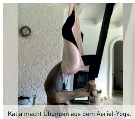
Katja macht Übungen aus dem Aerial-Yoga.

Katja Radbruch zu den Vorteilen dieser Form des Yoga. Auch anspruchsvolle Übungen meistert sie scheinbar mühelos. Dabei kommt ihr noch heute das Training für Leistungsturnerinnen im Alter von 5 bis 14 Jahren beim TuS Nortorf zugute. Die Wartezeit während des Schwimmtrainings der Kinder nutzt Katja Radbruch, um selbst jeden Donnerstag 2000 Meter zu schwimmen. Beim Joggen ist sie bis zu 10 km in der Feldmark unterwegs, allein oder mit Freundinnen zum schnacken.